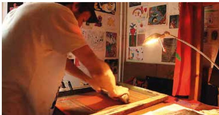
EXTRAIT DU DOCUMENTAIRE SUR LA SÉRIGRAPHIE