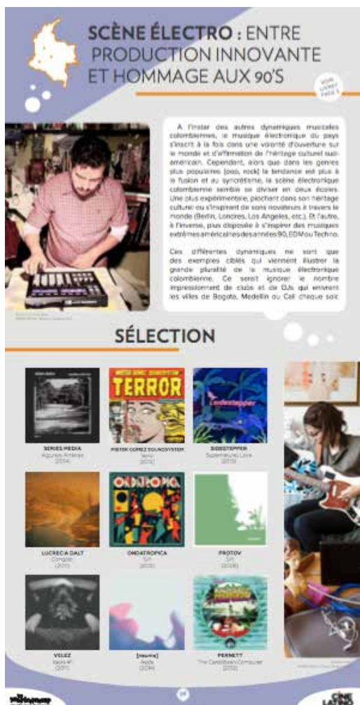
VISUEL D'UN PANNEAU ICI L'EXEMPLE DU PANNEAU RAP