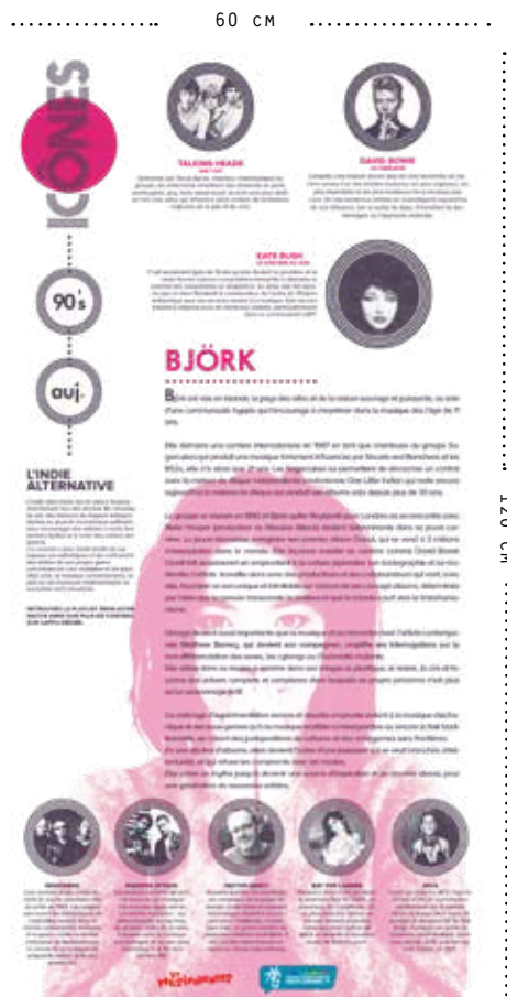
VISUEL D'UN PANNEAU ICI L'EXEMPLE DU PANNEAU INDIE ALTERNATIVE