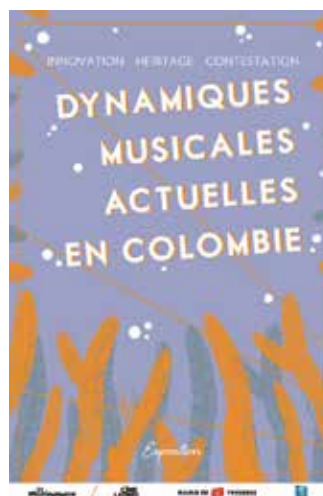
VISUEL DU LIVRET COUVERTURE