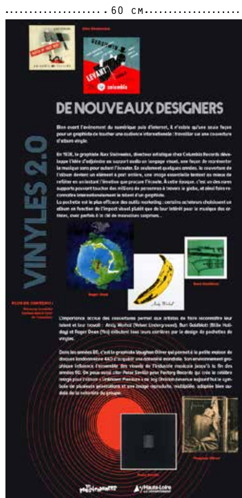
VISUEL D'UN PANNEAU