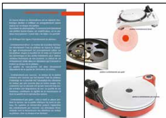
VISUEL DU LIVRET