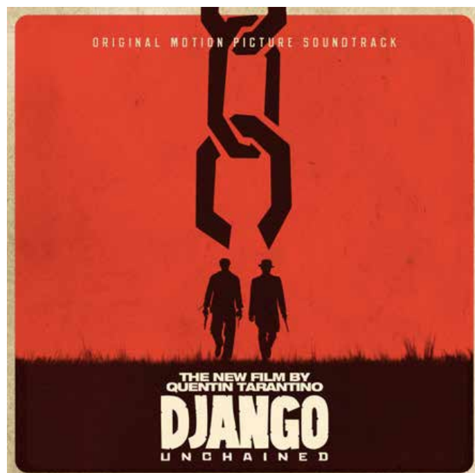
EXEMPLE D'UNE AFFICHE