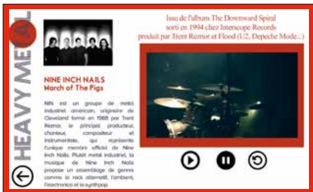
VISUEL DE L'APPLICATION INTERACTIVE ICI UN EXEMPLE EXTRAIT DE L'UNIVERS METAL