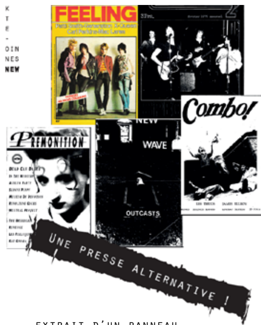
EXTRAIT D'UN PANNEAU