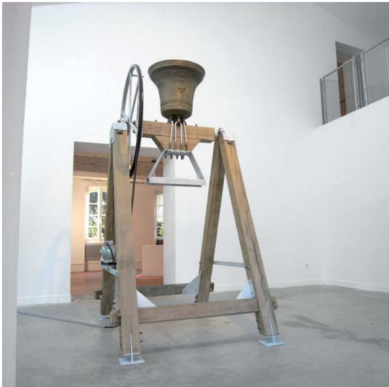
Cloche , Maison Salvan, Labège, 2012

Cloche sera présentée du 9 juillet au 28 août à la Chapelle des Carmélites, Toulouse