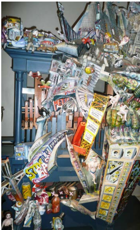
Street Art Organ, bois, métal et peau, 170x170x75cm, 1989