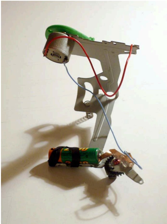
Arythme n°3 , 11x13x15cm, 2010