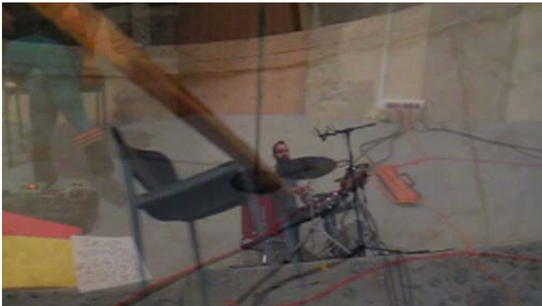
Love seats , (live remix) vidéo sur DVD

Nourri des cultures alternatives et populaires des années 50 à nos jours, mais aussi des avant-gardes artistiques, Arnaud Maguet s'inspire en premier lieu de la musique, principalement du rock. En amateur, en bricoleur, parfois en producteur, Arnaud Maguet mixe ses influences pour composer une œuvre protéiforme : installations, bandes-sons, pochettes de disques, affiches de concert, vidéos ou photographies, etc.