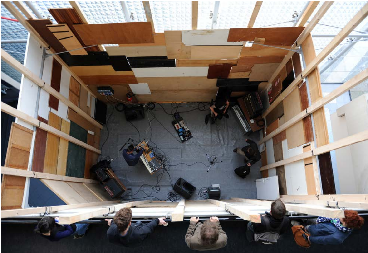
Arnaud Maguet, In my room , installation et performances, 400x500x500cm (structure), 2013 Œuvre présentée à l'université Toulouse le Mirail, collaboration Ciam La Fabrique/Croix-Baragnon.

9 juillet > 7 septembre 2013 galerie _Espace Croix-Baragnon Vernissage le 9 juillet à partir de 18h